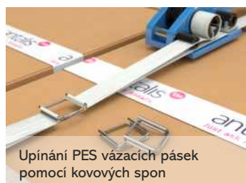
Upínání PES vázacích pásek pomocí kovových spon