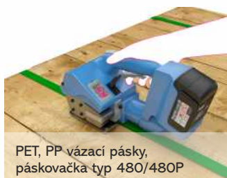
PET, PP vázací pásy, páskovačka typ 480/48OP