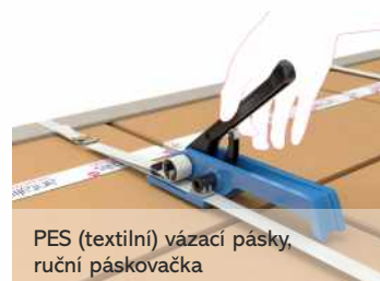
PES (textilní) vázací pásy, ruční páskovačka