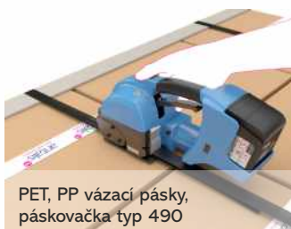
PET, PP vázací pásy, páskovačka typ 490